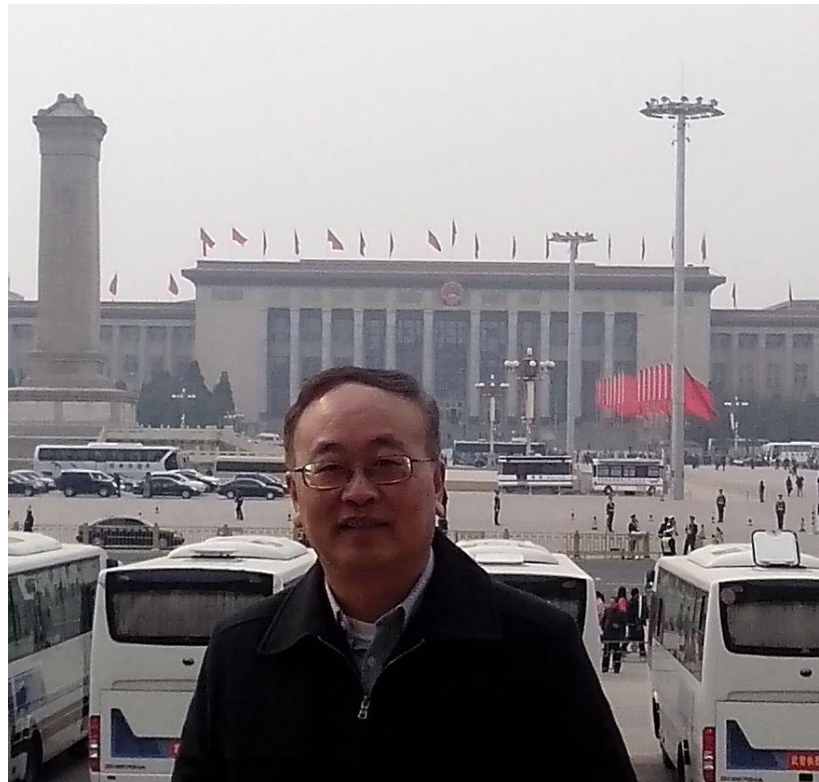
2016 和 1988 在天安门留影

中关村的新华书店，我过去常去。在这家书店，终于让我找到了一点对过去的回忆，又从书中看到了未来。